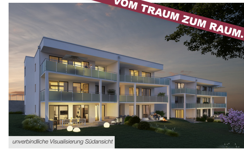
unverbindliche Visualisierung Südansicht