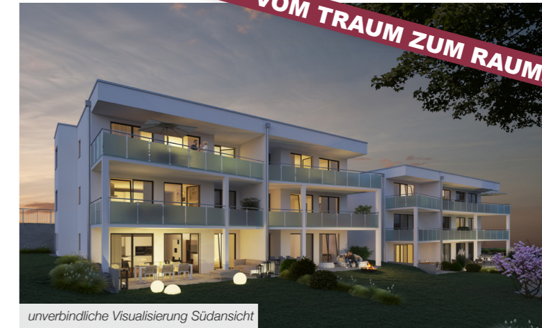
unverbindliche Visualisierung Südansicht