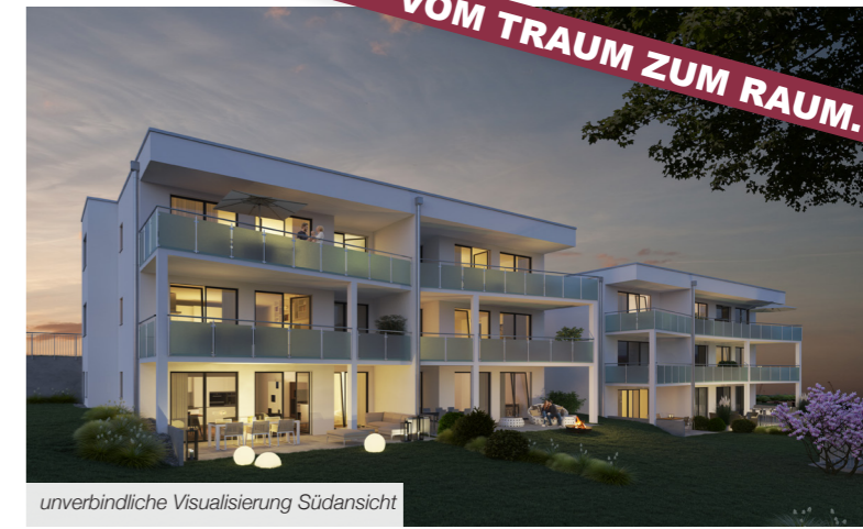
unverbindliche Visualisierung Südansicht